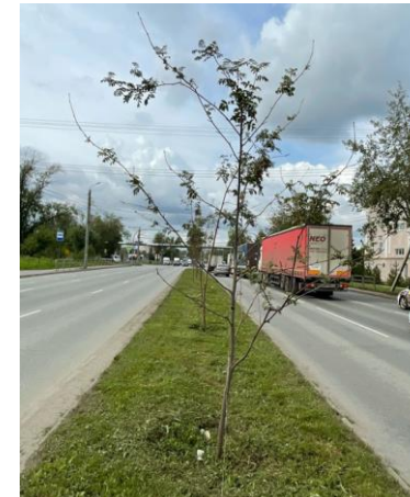
капитальный ремонт дороги к пос. Сухомесово Копейское шоссе от ул. Чистопольская до ул. Кольцевая