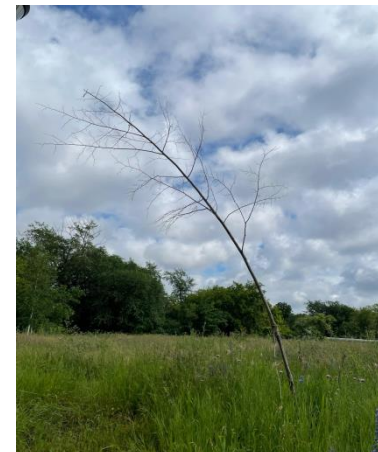
компенсационная посадка зеленых насаждений взамен снесенных на объекте «Строительство детского сада по ул. Габдуллы Тукая в мкр. №55 Краснопольской площадки №1»