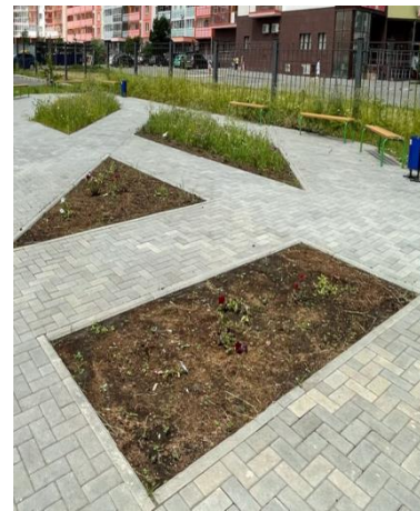
озеленение территории при строительстве школы в мкр. №1 Академ Риверсайд»